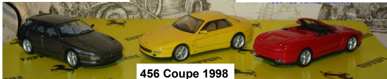
456 Coupe 1998