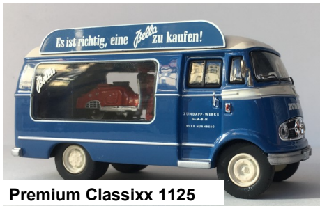
Premium Classixx 1125

Zo belanden we bij DKW, naast automobielen, ook fabrikant van motors en brommers. Hun open bestelwagen (F89), gebouwd van 1949 tem 1962 in Duitsland werd aangedreven door de bekende F8 2-takt 2-cilinder motor van 750 cc en 20 pk. Deze bestelwagen werd ook gebouwd in Spanje door Barreiros, in Finland door SISU, in Argentinië door IASF werkplaatsen alsook in de Indiaanse BAJAS fabrieken. Vanaf 1955 werd de F9 motor gebruikt, eveneens een 2-takt maar met een 3-cilinder van 900 cc die 34 pk leverde. Dit type werd ook in Jugoslavia gebouwd en in Nederland maakte Spijkstaal er een elektrische versie van.