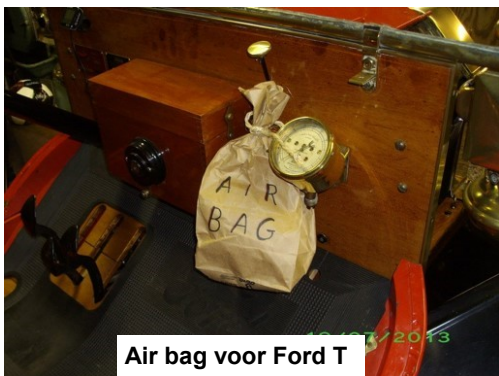
Air bag voor Ford T

Help de club groeien, geef jouw Wieltjes exemplaar of deze middenpagina weg (vraag gerust een nieuw Wieltjes) of laat het ergens liggen. Verdeel onze flyers voor onze ruilbeurzen aub en verdeel ze op beurzen of geef er in de winkels die je bezoekt.